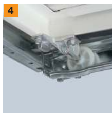
Absetzmulde für Laufrolle